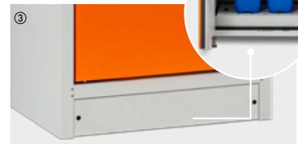
③ abnehmbare Sockelblende zum unterfahren