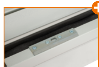
Innovative Türverriegelung oben und unten