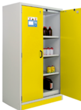
Typ 12/20 mit 3 Wannensböden und 1 Bodenwanne 44l