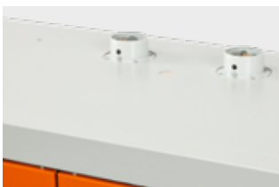
Anschluss für Zu- und Abluft

Die Serie PROline erfüllt die aktuelle Norm DIN EN 14470-1. Sie ist damit noch praxistauglicher und sicherer. Beim Brandkammertest im akkreditierten Prüfinstitut hat dieser Sicherheitsschrank mit über 107 Minuten am Markt die wahrscheinlich höchste Feuerwiderstandsfähigkeit erreicht. Um den Anforderungen an einen Profischrank gerecht zu werden, wurde viel Wert gelegt auf Sicherheit und durchdachte Funktionen.